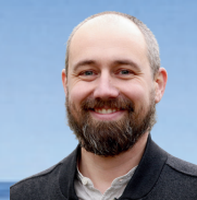
Joseph de Fraguier